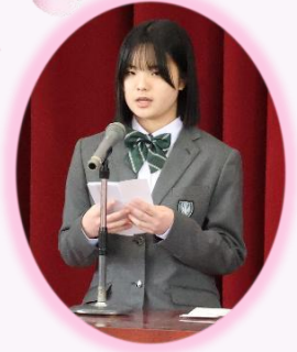
入学式 新入生代表宣誓 ▶