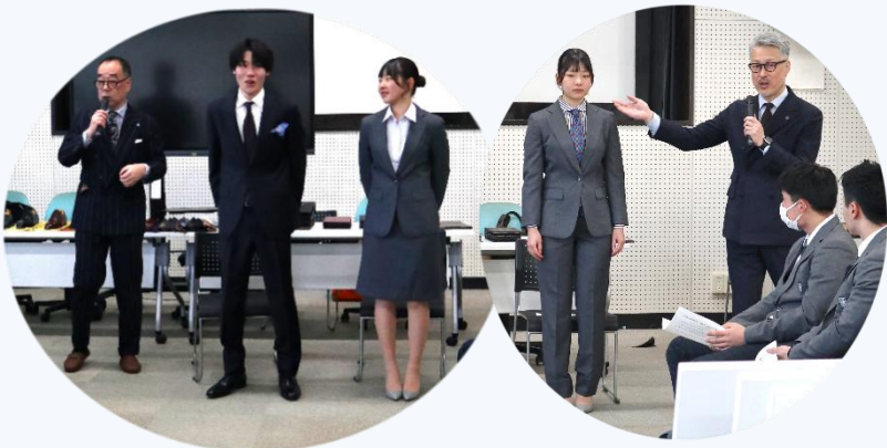
▲女性用は、スカート、パンツスーツの両方を用意していただき、どちらの魅力も感じることができました。

二人のスーツ姿を参考にしながら、スーツを着る時の大事なポイント・基本を押さえた「着こなしまナー7か条」を教えていただきました。