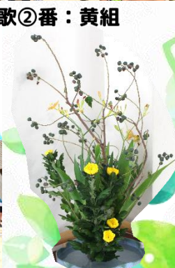
家庭クラブ 文化班による 生け花展示