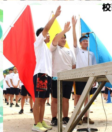
各色長による宣誓