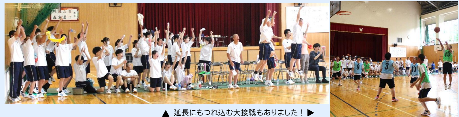
▲ 延長にもつれ込む大接戦もありました！ ▶

研修では様々な立場の先生でグループを構成し、活発な意見交換を行うことができました。「生徒を育てる」だけでなく「教員が育つ」という観点からも、非常に有意義な研修会になりました。