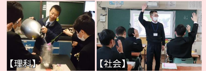
【理科】液体窒素を使った様々な「物質の状態変化」の実験

高校の教員が中学校に出かけ、理科・社会の2教科で出前授業を実施しています。今年度は2、3月に行いました。