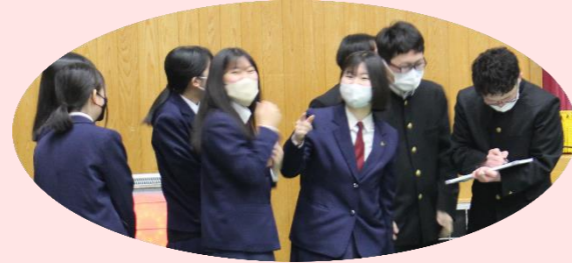
▲3年生 vs 教職員 クイズ

3年生代表挨拶では、「思い出ムービーで3年間は振り返ることができて楽しかったです」「部活動や寮生活、生徒会活動などたくさんの経験をさせてもらい、いい思い出になりました。今、前向きに卒業式を迎えられるのも、様々な方のお陰だと思います。」という言葉が聞かれました。