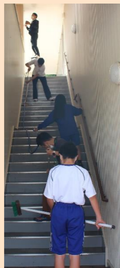
▲中央図書館横の外階段

当日は天気恵まれ、中学生や地域の方と一緒に協力して清掃を行うことができました。今後もきれいな町づくりを意識しながら過ごしていきましょう。