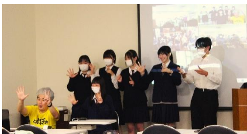
▲課題発見ワークショップで全国各地の高齢者施設とリモートで繋がり、自分達の考えた健康体操を利用者さんに体験してもらいました。