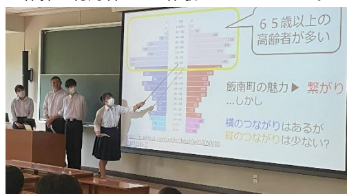
▲この班は桃山学院大学で課題研究を発表。テーマは【飯南町の野菜で漬物を作ろう！】