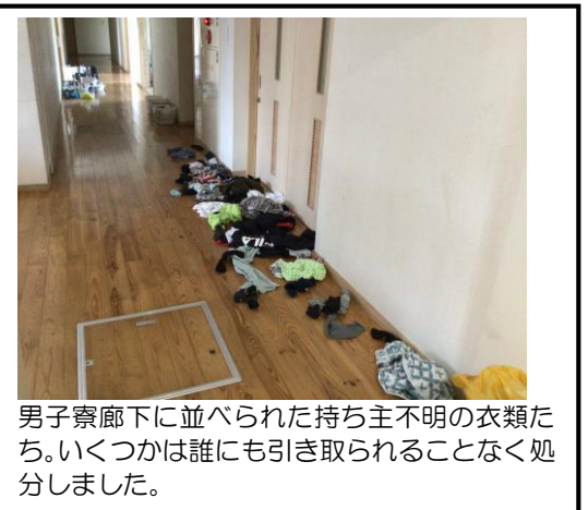
男子寮廊下に並べられた持ち主不明の衣類たち。いくつかは誰にも引き取られることなく処分しました。