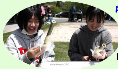
▶まきまきパン作り

生徒は「 猛毒の花が意外と普通の姿でびっくりした。散策する中で、谷地域の人とたくさん話ができ、子どもたちにいろんなことを教えてもらえた。普段は食べられない山菜の天ぷらがおしかった 」などと話していました。