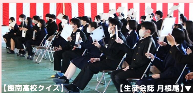
【飯南高校クイズ】 【生徒会誌 月根尾】

この日は、生徒会誌「月根尾」も配布されました。卒業式前の最後の行事となり、生徒会執行部を中心に工夫を凝らし、3年生に楽しんでもらおうとする思いが伝わってきました。