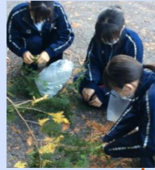
クロモジの他にヒノキでも試作

飯南町の森林セラピーは、定期的に通うことで健康体が維持できるため、森林セラピーを思い出すきっかけになるものを作り、リピーターを増やそうと考える。そこで、嗅覚に働きかけようと、クロモジを使ったアロマキャンドルをセラピー体験者に提供しようと試作を重ねる。