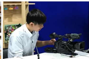
▲雲南夢ネット飯南局