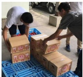
▲JAしまね飯南営農経済センター