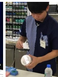
▲ローソン・ポプラ