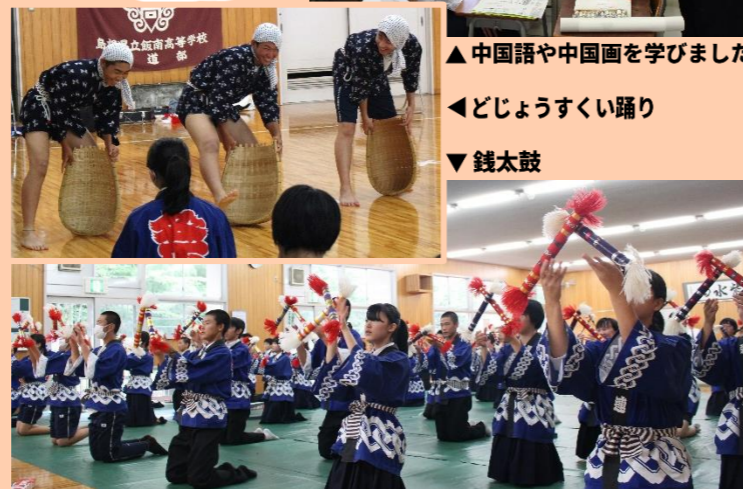
▲中国語や中国画を学びました