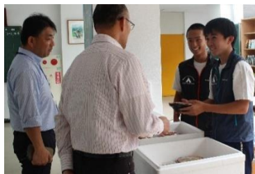
▲琴引ビレッジ山荘