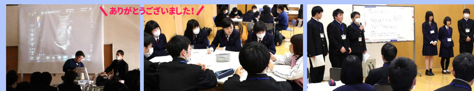
▲医療機器体験:エコーで内臓を見てみよう! ▲看護師さんにインタビュー ▲発表 会場:飯南町保健福祉センター