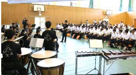
▲吹奏楽部による演奏