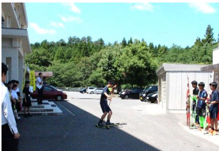
▲部活動見学【スキー部】