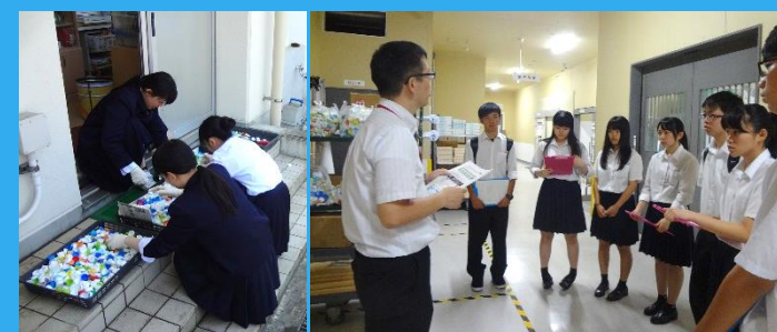
▲学校で収集したキャップの洗浄・選別作業を行いました。

今後もボランティア活動を通して様々な取組や人とのつながりを大切にしていきたいと思います。