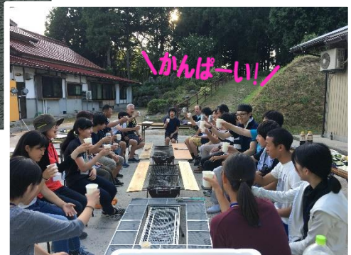
地域の皆さんと バーベキュー▶