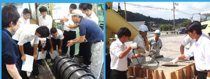
お世話になった企業の皆様、ありがとうございました！

10月にはインターンシップ（就業体験）も控えています。今回の進路学習に続き、進路について、将来についてしっかりと考え、視野を広げる機会にしてほしいと思います。