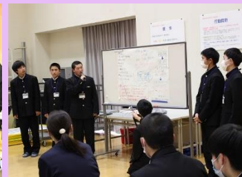
会場:飯南町保健福祉センター