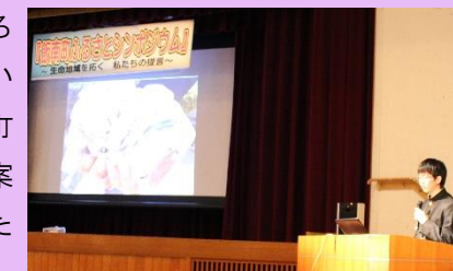
会場:赤名農村環境改善センター

その後のグループワークでは、『飯南町の活性化のために自分ならどんな提案をするか』というテーマについて実現の難易度、効果の大きさなども考慮しながら地域の方も交えて話し合いました。「自分達がスポーツを楽しみながら元気な声を出すことで、町も元気になる」などいろいろな意見を出し合い様々な角度から飯南町の活性化に向けた提案を考えることができたようです。