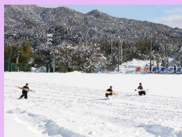
野球部:雪上ランニング!