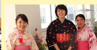
茶道同好会【お茶席】