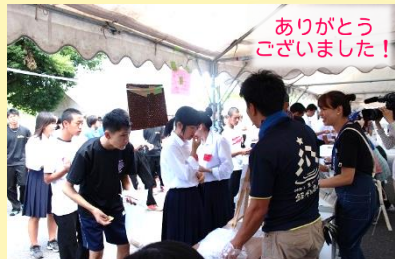
鷗雲会・PTA協賛模擬店 販売メニュー多数!大盛況でした!