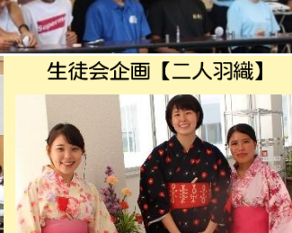
生徒会企画【二人羽織】