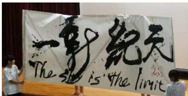
書道同好会がテーマの揮毫を披露!

*空の高さこそが限界になる、つまり可能性は無限大である—という意味の諺です。生徒が考えてくれました。