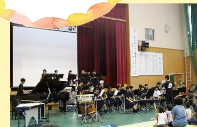
吹奏楽部 中高合同演奏

町内の保育所・中学校、近隣小学校の児童・生徒を招待し、吹奏楽部の中高合同演奏や、クラスのパビリオンを楽しんでいただきました。