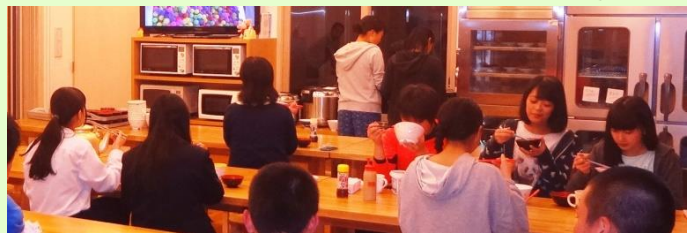
▼普段の食事の様子です