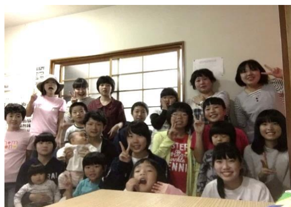
【志津見地区の皆さんと交流】

今年度は【ホストファミリー】として8組の地域の皆さんに登録していただき、県外出身の14名の生徒がこの制度の活用を希望しました。そして、2学期から『ホストファミリー制度』が始まり、地域行事への参加やご家庭に宿泊させていただいての交流を図っています。生徒は学校生活とはまた違った形で飯南町の魅力を体感しています。