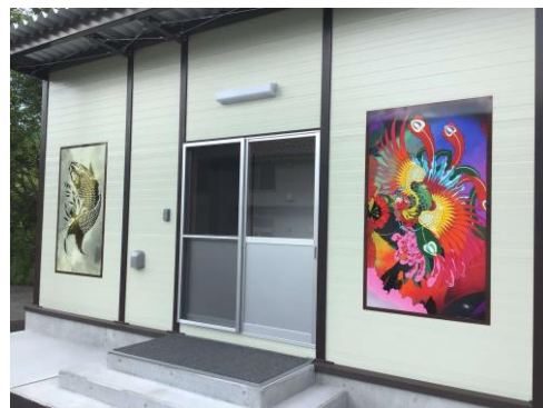
↑静養棟の壁にある絵は卒業生の作品です

3月に、寮の駐車場だった場所に静養棟が完成しました。これは、もともとある男女1室ずつしかない静養室不足を解消するために建てられたものです。現在室内を整備し、利用方法を検討しているところです。