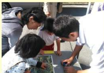
生命地域学 課題研究 「ハザードマップを知ってもらおう」

また、今年は生命地域ラボから神楽愛好会が「第9回高 校生の神楽甲子園」に出場しました。このように全校生徒の 姿は学校だけではなく地域全体の活力を高めています。一 方で母校をとりまく環境は厳しさを増しています。飯南町 内の中学生の数が減少の一途をたどっていることです。今 後飯南町中学卒業生が30人前後で推移することを考えれば 本当に厳しい状況ですが近年、飯南町と学校の努力で現在 は飯南町出身の生徒数を、県外を含む町外中学卒業生が上 回る状況になりました。このように、町内生、町外生が力を 合わせて学校生活を送っている姿から私たちも大きな力を 得ていると感じています。そうした厳しい状況ですが、それ だけに私たち卒業生が一致団結して支えていかなければな りません。皆様のご理解とご協力を心から願います。そ のためにもどうか会費の納入をよろしく願いいたします。 結びに皆様のご健勝、ご多幸を祈念し挨拶とします。