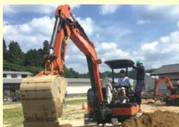
生命地域学 中山間地域研究センター実習 建設業体験

徒数が増加し、統廃合の危 険な状況に陥っています。中 学校の卒業生が減少する 中で、町外・県外からの生 徒数が増加し、統廃合の危 険な状況に陥っています。